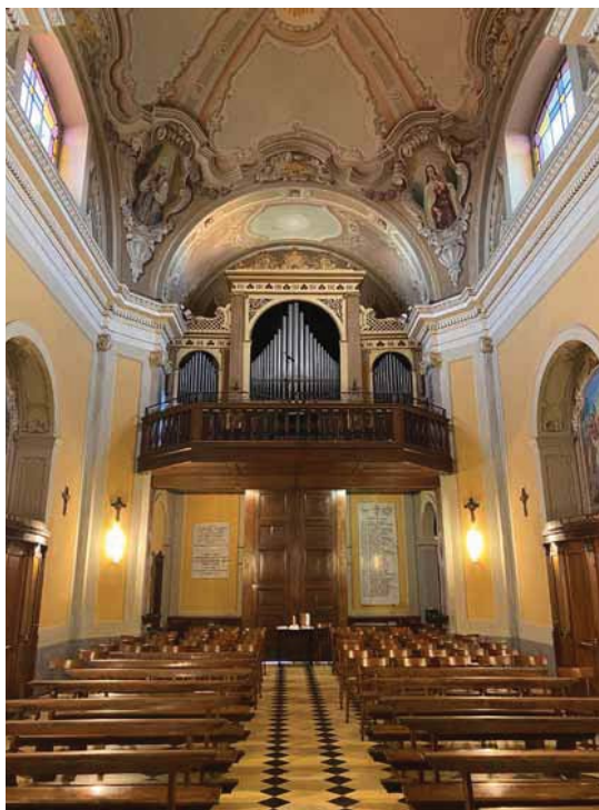
L'ORGANO DI CIVELLO