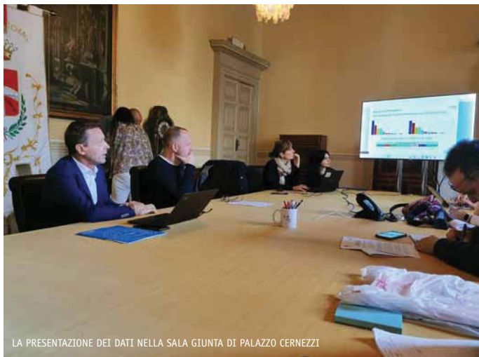
LA PRESENTAZIONE DEI DATI NELLA SALA GIUNTA DI PALAZZO CERNEZZI