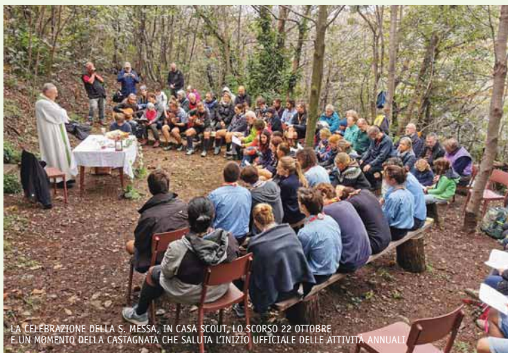
LA CELEBRAZIONE DELLA S. MESSA, IN CASA SCOUT, LO SCORSO 22 OTTOBRE E UN MOMENTO DELLA CASTAGNATA CHE SALUTA L'INIZIO UFFICIALE DELLE ATTIVITÀ ANNUALI